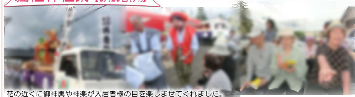
花の近くに御神輿や神楽が入居者様の目を楽しませてくれました。