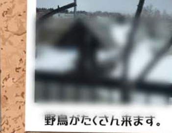
野鳥がたくさん来ます。