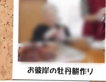
お彼岸の牡丹餅作り