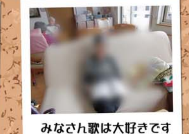
みなさん歌は大好きです