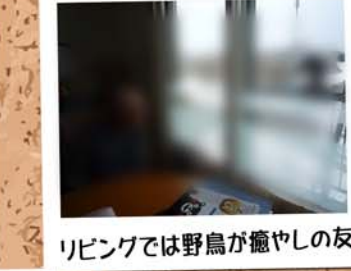
リビングでは野鳥が癒やしの友