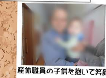
産休職員の子供を抱いて笑顔